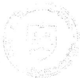
Vladimír Bajan starosta

Proti tomuto rozhodnutiu je možné podať odvolanie do 15 dní odo dňa jeho oznámenia na mestskej časti Bratislava-Petržalka, Kutlíkova 17, 852 12 Bratislava, pričom odvolacím orgánom je Okresný úrad Bratislava, odbor výstavby a bytovej politiky. Toto rozhodnutie je preskúmateľné súdom po vyčerpaní riadnych opravných prostriedkov.