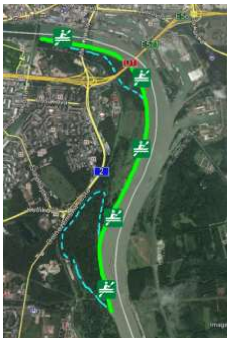
Lagúna Lido pre rekreáciu a vodné športy – dunajská pláž v centre

Integrálnou súčasťou myšlienky Kajakárskej magistrály Lido – Ovsište – Starý háj je aj zámer vytvorenia plážovej Lido lagúny pre rekreáciu a vodné športy v lokalite Lida.