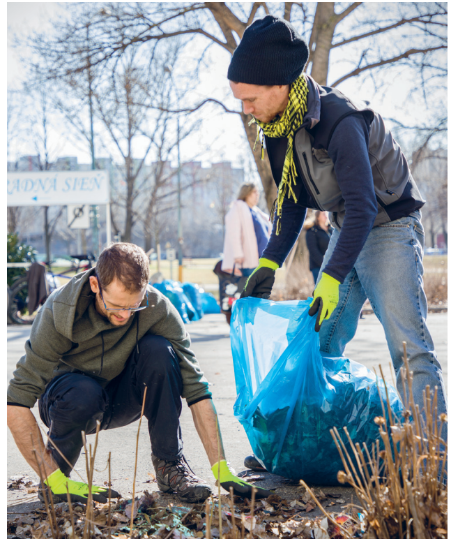
Zamestnanci z oddelenia životného prostredia mestskej časti pri čistení areálu Cik Cak Centra, kde vyzbierali 20 vriec odpadu.