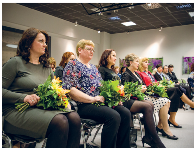
Oceňovanie učiteliek petržalských základných a materských škôl na Dňoch učiteľov 2019.