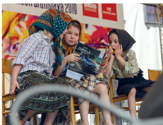
Vystúpenie detí na podujatí "Petržalka na Hlavnom námestí 2019".