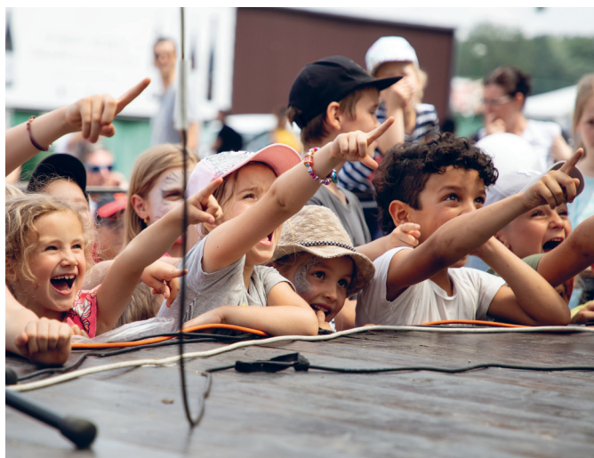
Oblíbený festival Dni Petržalky si užili aj malí návštevníci.