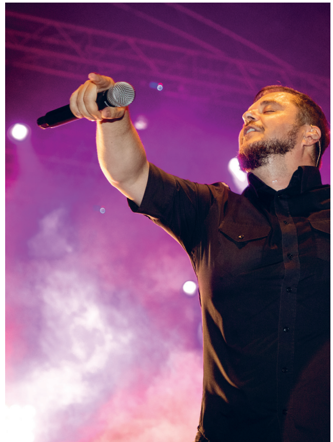
„Kuly“ zo skupiny Desmod to na záver programu Dní Petržalky poriadne roztočil.