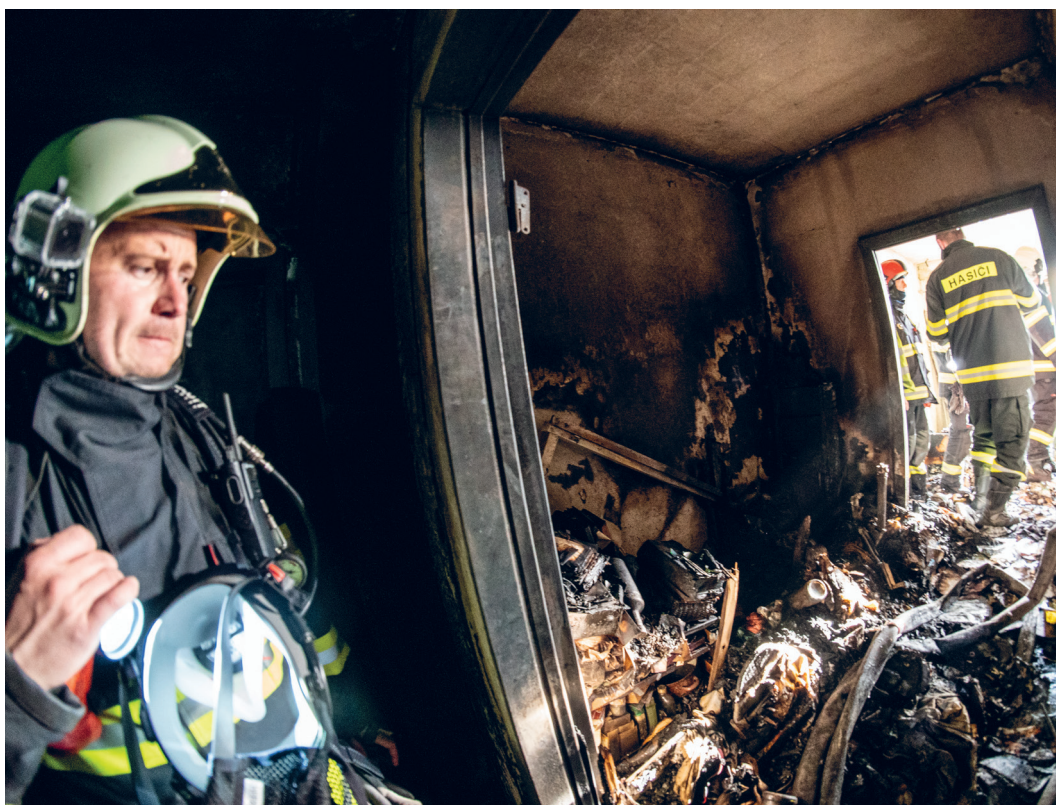
Zásah hasičov pri marcovom požiari bytu na Viglašskej ulici.