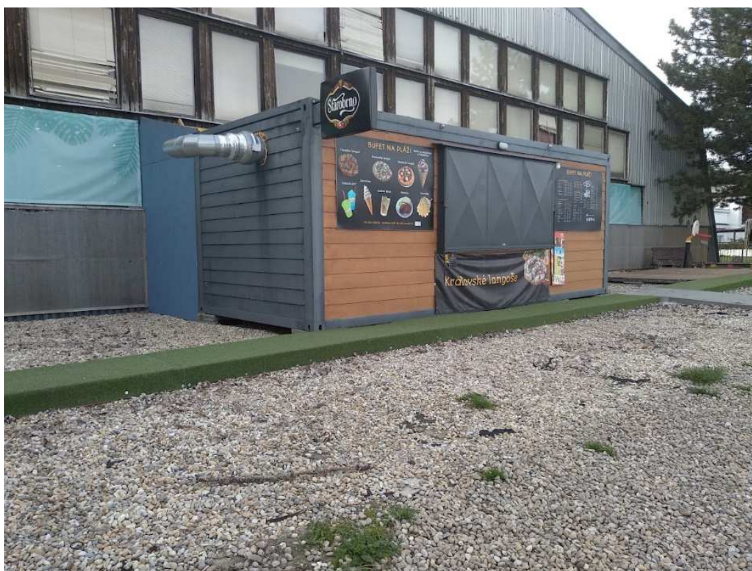
Vzhľad stánku na predošlom mieste nájmu