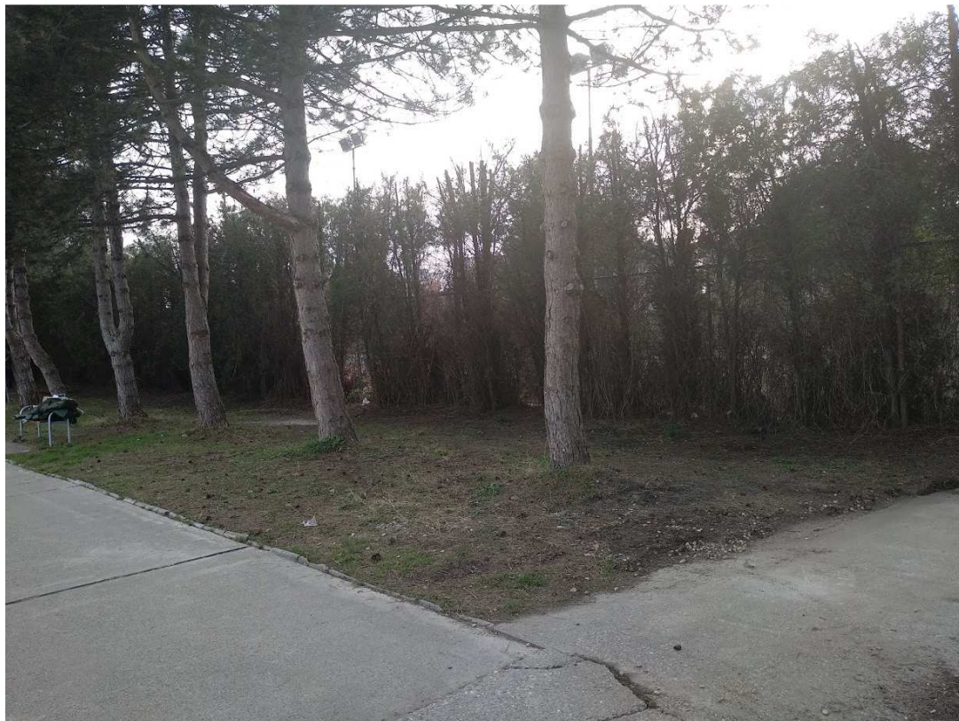
časť pozemku parc. č. 2842/3 -miesto prenájmu