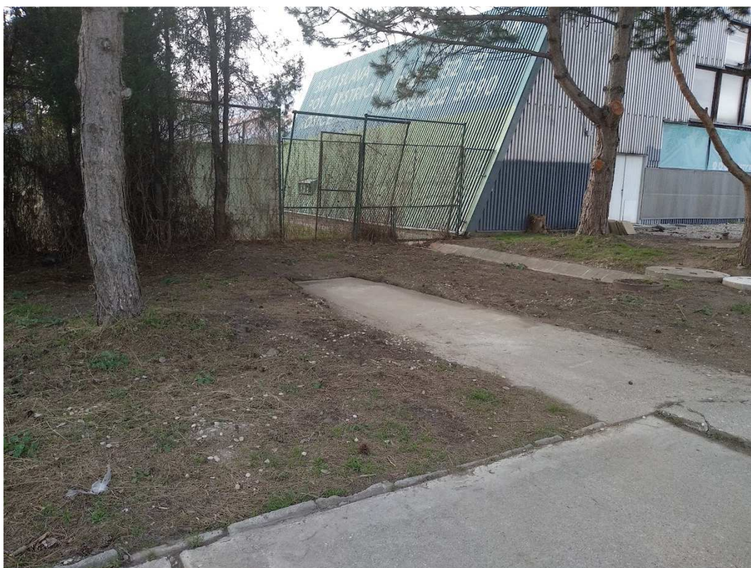
časť pozemku parc. č. 2842/3 -miesto prenájmu