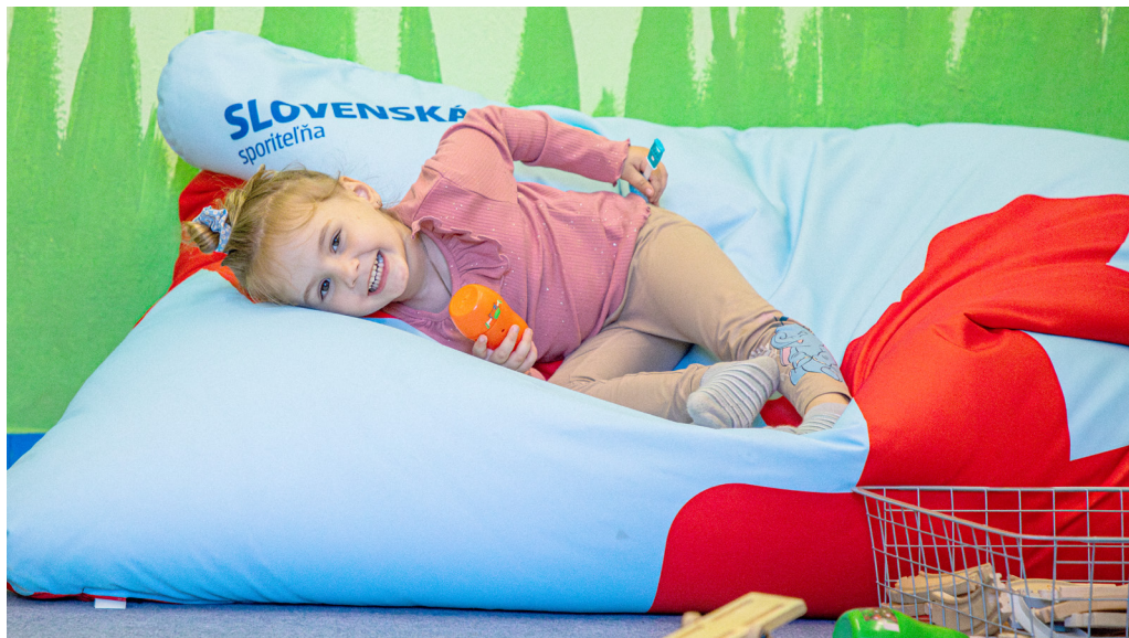
Skákanie do hradby z tullivakov patrí medzi najobľúbenejšie zábavky.