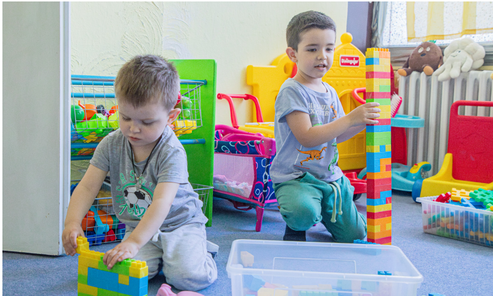
Centrum pre ukrajinské deti na Bzovíckej je určené pre deti od 3 do 5 rokov.

Pred rokom začalo v Petržalke fungovať Centrum pre ukrajinské deti.