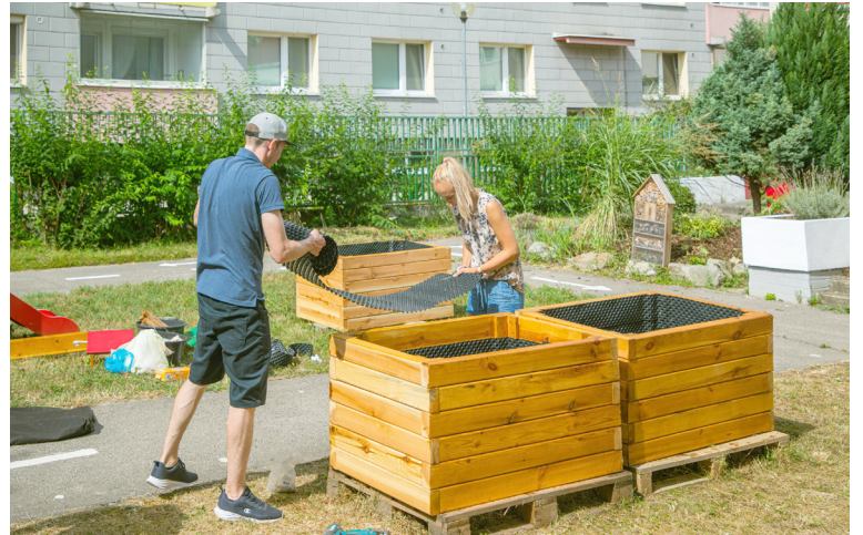
V areáli škôlky pribudli vyvýšené záhony a v nich bylinky i zelenina.