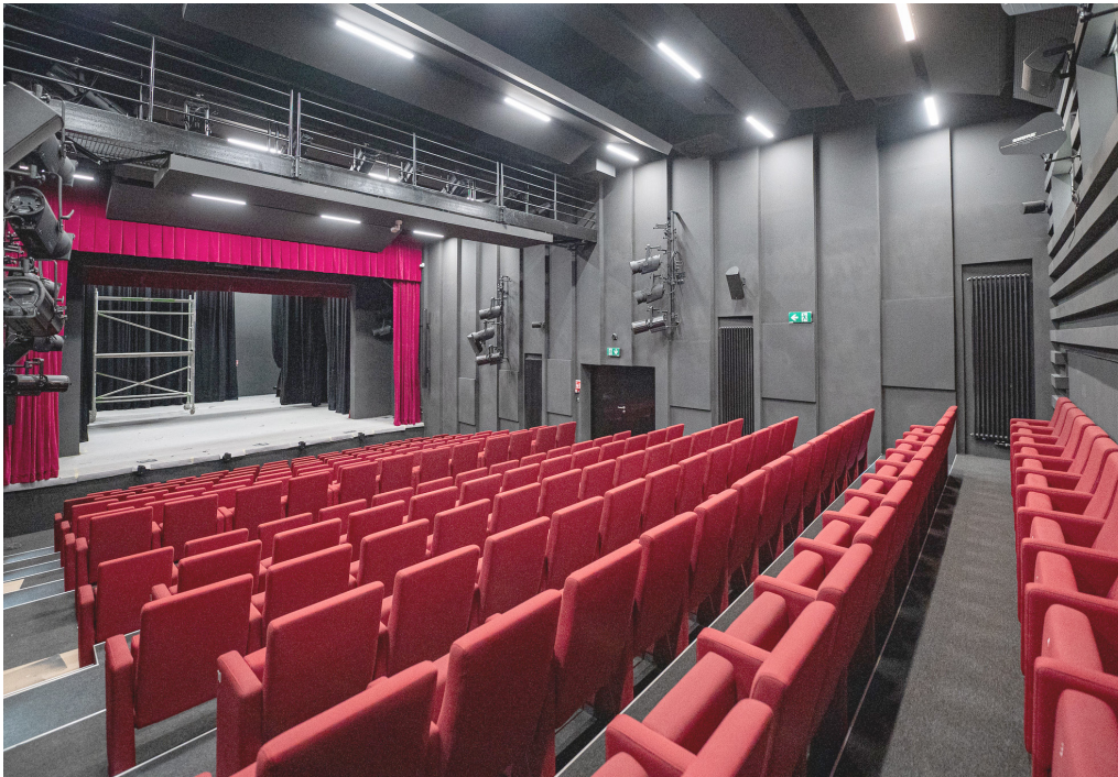
Vďaka komplexnej rekonštrukcii sa bábkoherci po desiatich rokoch konečne vrátia na svoju domovskú scénu – do Bratislavského bábkového divadla na Dunajskej ulici.

Župné bábkové divadlo spustilo predaj lístkov na predstavenia v jesennej sezóne. Prvýkrát sa odohrajú v zrekonštruovaných priestoroch na Dunajskej ulici.