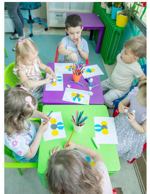
Deti malujú, lepia, strihajú, veľa pracujú s prírodnými materiálmi.

„Dodnes nie je všetko hotové, vylepšujeme to tu každý deň, ťažko urobiť všetko na jeden raz,“ smeje sa. Aktuálne by akútne potrebovali vyriešiť vchodové dvere. „Lebo v zime je tu veľmi chladno.“