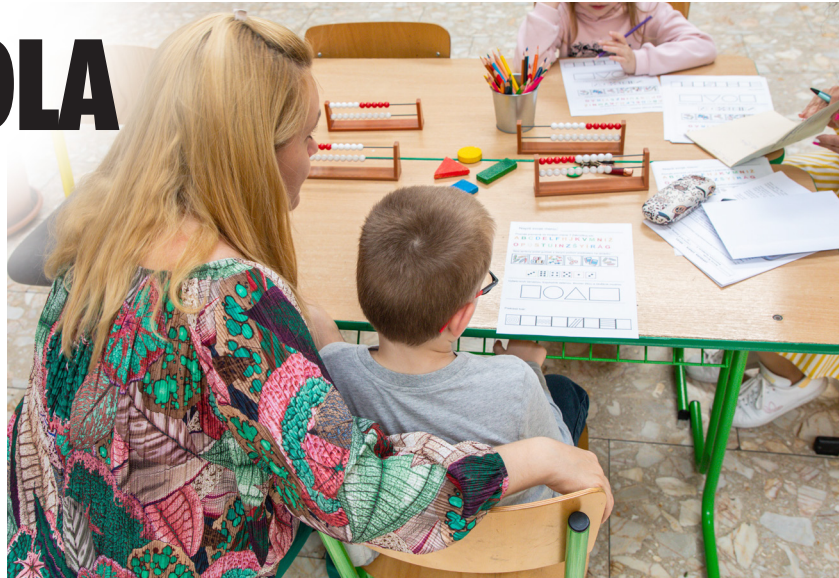
Reforma má deti naučiť použiť vedomosti v praxi.

Cisár zároveň priznáva, že na zapojenie školy do reformy už v skúšobnej fáze mal aj pragmatické dôvody: „Keďže zatiaľ je súčasťou len časť škôl, pomoc a podpora z Národného inštitútu vzdelávania mládeže (NIVAM) a Regionálneho centra podpory učiteľov (RCPU) je oveľa väčšia, než bude, keď sa zapoja všetky. A tým pádom je ten rozbeh pre nás jednoduchší.“