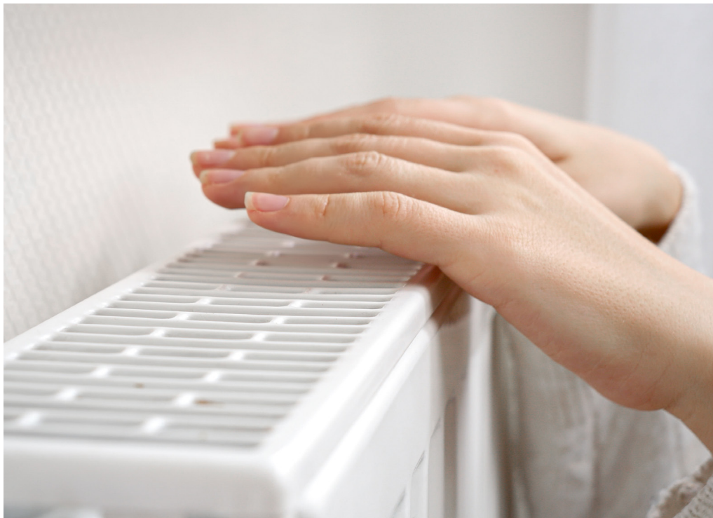
K spusteniu vykurovania zväčša dôjde počas mesiaca september, no záleží to od vývoja počasia v jednotlivých lokalitách.

S príchodom chladnejších dní sa na nás zákazníci obracajú s otázkami ohľadom spustenia vykurovania. Pre čitateľov novín Naša Petržalka sme pripravili odpovede na najčastejšie otázky, veríme, že im pomôžu zorientovať sa v tejto oblasti.