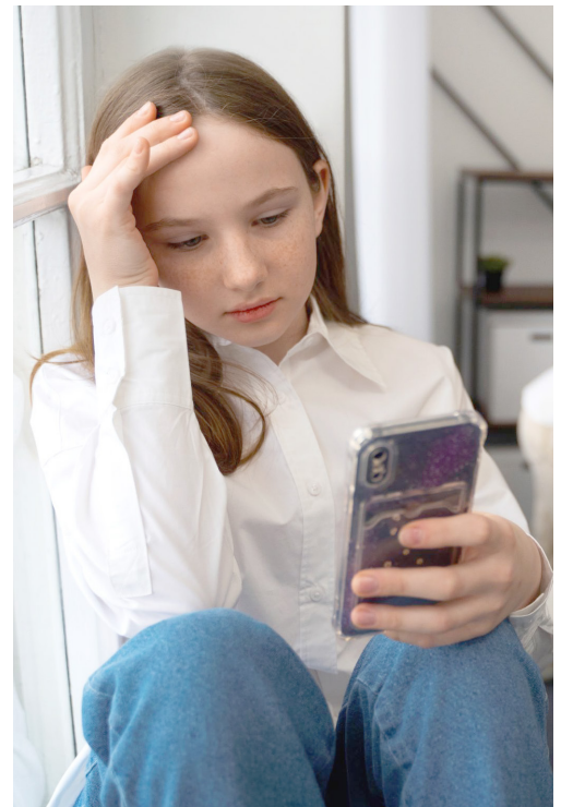
Kyberšikana je obrovská psychická záťaž. Následky môžu vyústiť až do závažných duševných či fyzických ochorení.