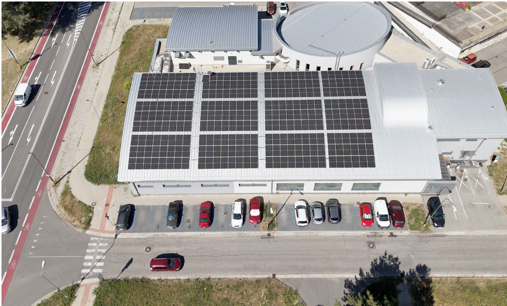
Na streche plavárne od júla šetrí náklady na energiu 270 fotovoltaických panelov.

Ročne dokáže ušetriť na energiách až 40-tisíc eur.