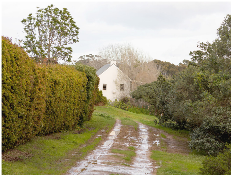
Nehnuteľnosť musí byť prístupná z účelovej, miestnej alebo inej komunikácie, no nie je nič atypické, ak prístup prechádza cez pozemok suseda.