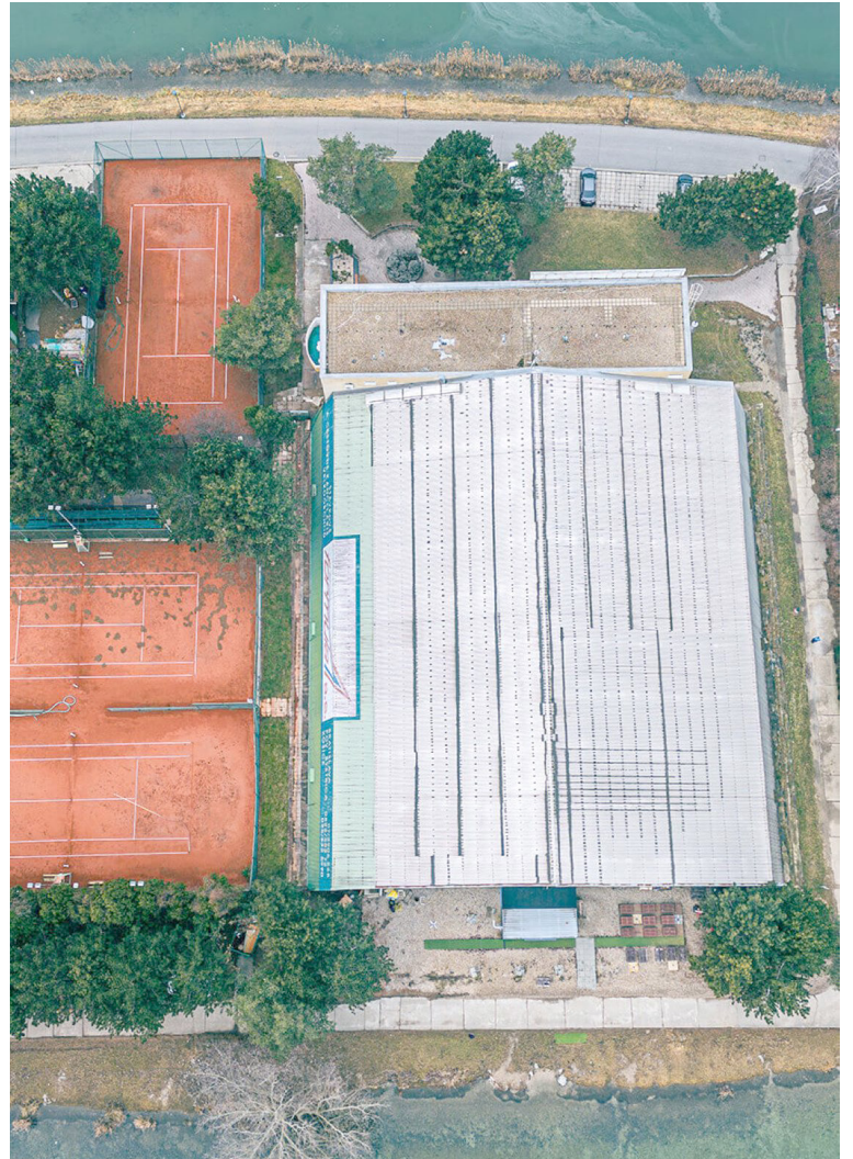
Samospráva chce s obnovou haly začať už v septembri 2024, práce by predbežne mali trvať do augusta 2026.