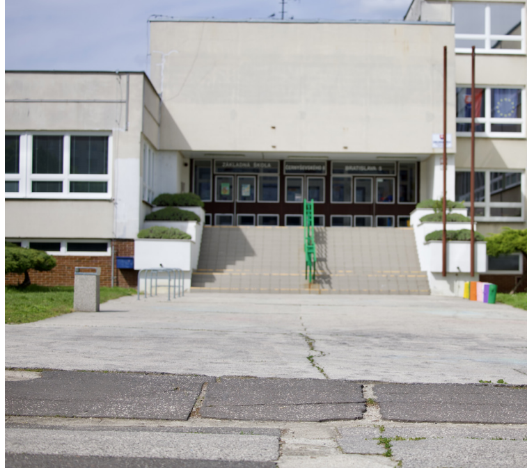
ZŠ Černyševského: Jazdiť do školy na bicykli či na kolobežke bráni deťom zlý povrch chodníkov.

Ďalším problémom je, že obidva vstupy do školy vedú cez parkovisko, čo je potrebné zmeniť a vytvoriť tak bezpečný vstup pre všetky druhy dopravy. Zmena je