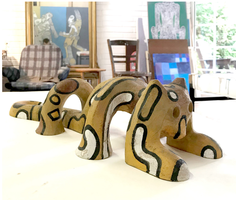
Model plastiky mačiaka.