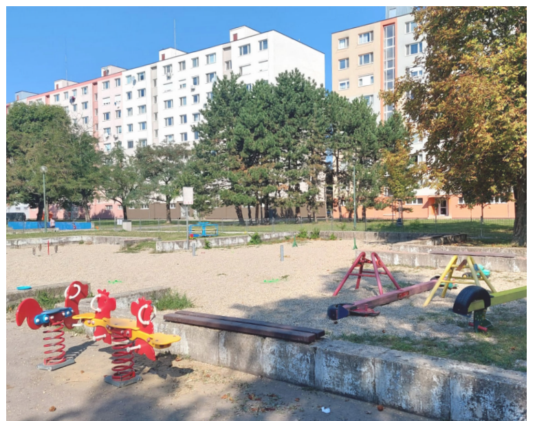
Verejné detské ihrisko na Starhradskej už onedlho skrášlia nové preliezky.