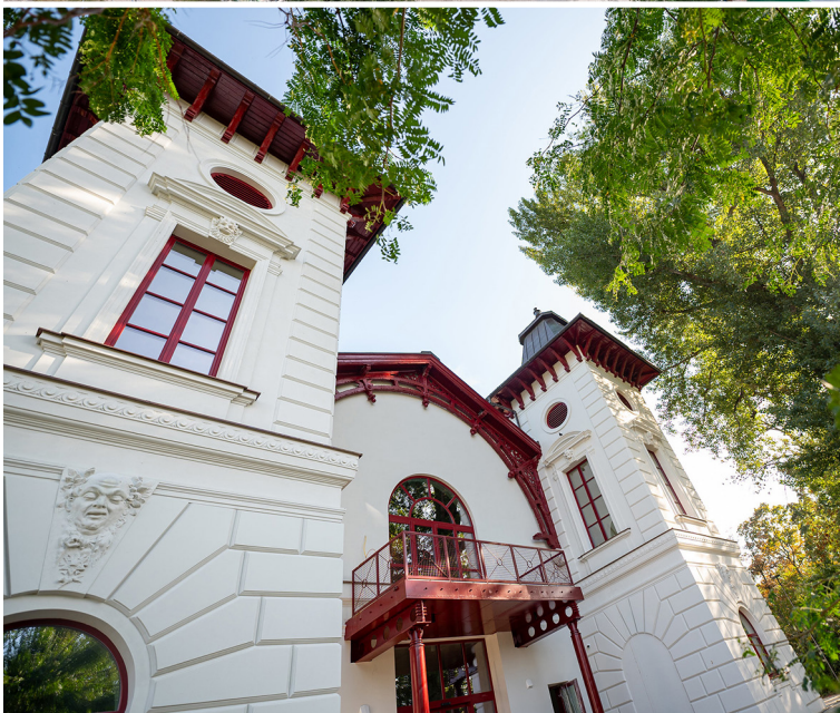
K najväčším investíciám bratislavskej župy do kultúry patrí obnova divadla Aréna na Tyršovom nábreží. Náklady na rekonštrukciu sa vyšplhali na 12 mil. eur.