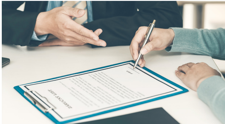
V Európskej únii trvá štandardná záruka 24 mesiacov.

Záručná doba je pre spotrebiteľov jedným zo základných práv pri nákupe tovarov a služieb.