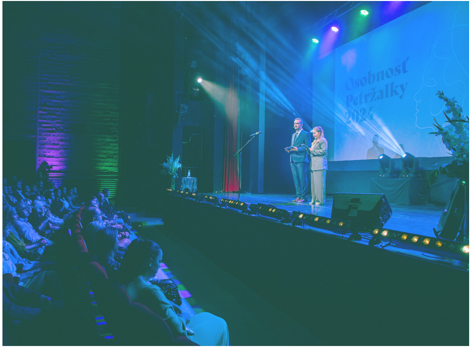
Slávnostný galavečer sa konal v Dome kultúry Zrkadlový háj.

stolnotenisových Majstrovstiev sveta v Sarajeve v roku 1973, kde vyhrala striebornú medailu v dvojhre a bronzovú v zmiešanej štvorhre. Od roku 2018 organizuje v rámci Slovenska podujatia k Svetovému dňu stolného tenisu.