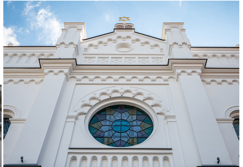
Cieľom rekonštrukcie seneckej synagógy bolo popri záchrane pamiatkových hodnôt aj vytvorenie kultúrneho centra.