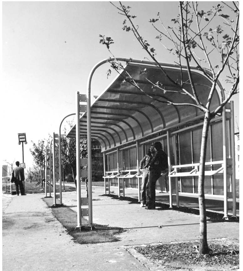
Prototyp prístrešku pre MHD na Ružinovskej ulici, 1978.