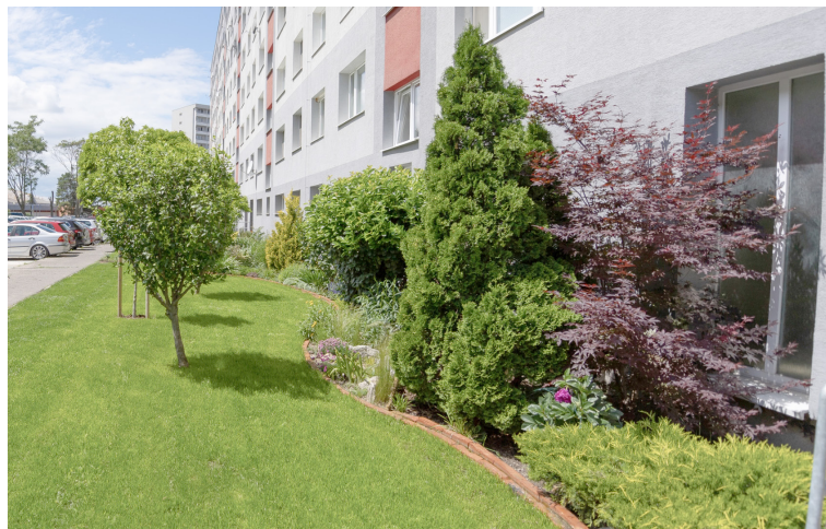
Víťazná predzáhradka na Budatínskej 81.

Pri tvorbe koncepcie záhradky sa rozhodol spoľahnúť na odborníkov a využil pomoc profesionálov z miestneho úradu v rámci projektu Petržalské predzáhradky. Základný koncept postupne sám dotváral – a to aj z vlastných financií. Alfou a omegou sú stromy a najmä trávnik, ktorého trvalú zeleň dokonca podporil inštalovaním závlahového systému. Hoci väčšinu starostlivosti o predzáhradku zastane sám, práve s trávnikom mu pomáhajú dve susedy vo veku osem a desať rokov. „Až sa urazí, keď ich nenechám trávnik pokosiť,“ vraví Gergel a dodáva, že s dievčatami sa podelil aj o ceny, ktoré získal za víťazstvo v petržalskej súťaži.