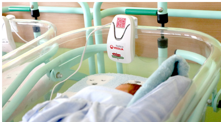
Monitory dychu trvalo detekujú dychové pohyby dieťaťa a v prípade potreby dokážu privolať pomoc.

Syndróm náhleho úmrtia dojčiat, známy ako SIDS, je náhle a nečakané úmrtie dieťaťa počas spánku v postieľke. Na Slovensku