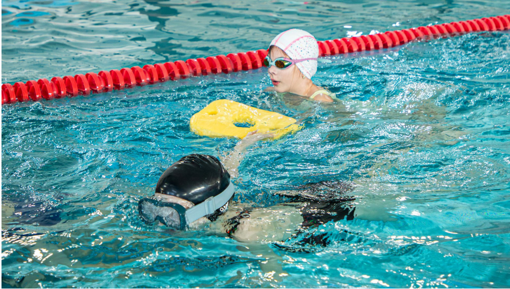
Aj vďaka spolupráci s externými partnermi môžu deti z desiatich petržalských základných škôl absolvovať plavecké kurzy zadarmo.

Po tom, čo Mestská časť Bratislava-Petržalka rozbehla v septembri futbalové krúžky pre deti pod vedením kvalifikovaných trénerov, prichádza s ďalším športovým projektom. Ide o plavecké kurzy pre žiakov 3. a 4. ročníkov základných škôl v zriaďovateľskej pôsobnosti samosprávy, ktoré sú však na rozdiel od tých futbalových bezplatné. A to aj vďaka spolupráci Petržalky s externými part-