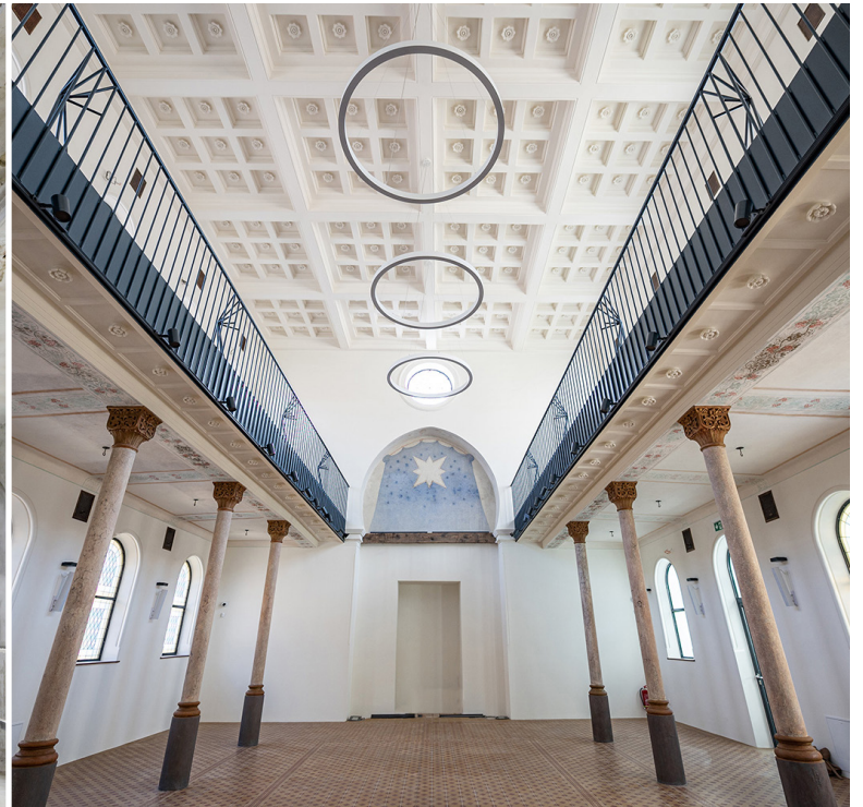
Zrekonštruovaná synagóga v Senci otvorila svoje brány pre verejnosť 10. septembra. Súčasťou obnovy za približne 3 mil. eur bola aj výstavba novej budovy a vytvorenie parkovej záhrady.

Bratislavský samosprávny kraj (BSK) sa pustil do komplexnej rekonštrukcie národných kultúrnych pamiatok, výsledkom sú obnovené a technologicky zmodernizované budovy. Verejnosti už župa predstavila obnovenú Synagógu v Senci, Bratislavské bábkové divadlo, tesne pred otvorením je Divadlo Aréna. BSK tiež získal do dlhodobého prenájmu Malú scénu STU na Dostojevského rade v Bratislavskom Starom Meste.