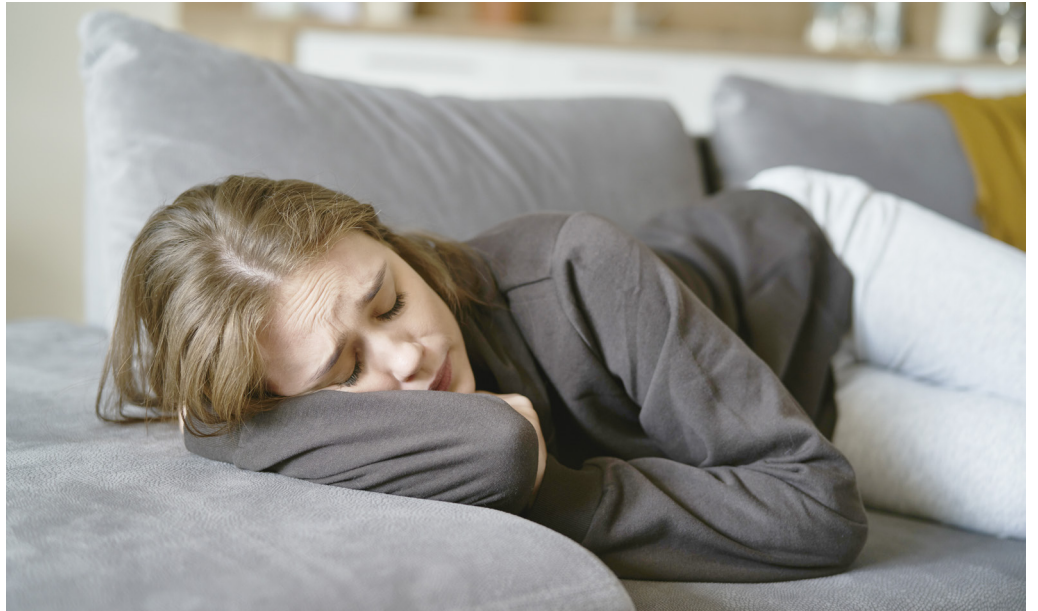
Aj v Petržalke žijú „neviditeľní“ ľudia so psychickými problémami, ktorých – z rôznych príčin – nezachytila sociálna a zdravotná sieť.

Chcem však zdôrazniť, že ani ja a ani nikto na našom oddelení nemáme medicínske vzdelanie. Napríklad ja čerpám výlučne z profesijnej skúsenosti streetworkera a človeka, ktorý niekoľko rokov viedol v našom meste projekt Sociálneho divadla vytvárajúceho priestor na sebarealizáciu aj ľuďom so psychickými poruchami.