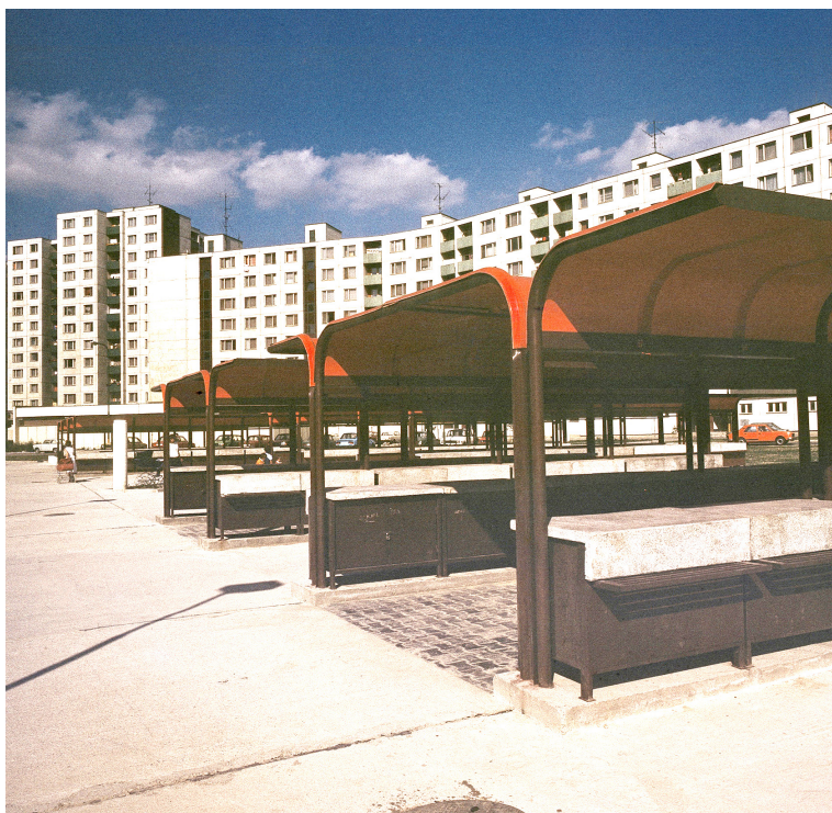
Trhovisko na Topoľčianskej, okolo 1985.

Z troch oranžových podchodov na Dolnozemskej ceste funguje už len jeden, bohužiaľ, spolu s podchodom na Rusovskej ceste „modernizáciou“ podstatne stratil pôvodný architektonický výraz. Charakteristicky vymodelovaný tvar prístrešku nahradil plech, ktorý prekrýva oceľové rúrky a absolútne neguje princíp založený na priznaní konštrukcie s tým, že laminátový prístrešok bol upevnený pod ňou.