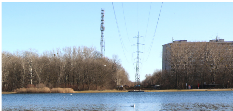
O prekládke elektrického vedenia nad petržalským Draždiakom sa už hovorí roky. Obyvatelia sa obávajú, že by spôsobila spolplatenie obľúbeného kúpaliska.