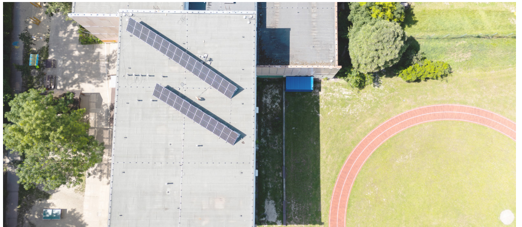
Veolia Energia Slovensko odštartovala pilotný projekt zdieľania elektriny z obnoviteľných zdrojov.

V auguste 2024 skupina Veolia Energia Slovensko odštartovala pilotný projekt zdieľania elektriny z obnoviteľných zdrojov. Prvým klientom novej služby je mestská časť Bratislava-Petržalka, ktorá je dlhoročným strategickým partnerom skupiny pri výrobe a dodávke tepla v rámci systému centralizovaného zásobovania teplom (CZT).