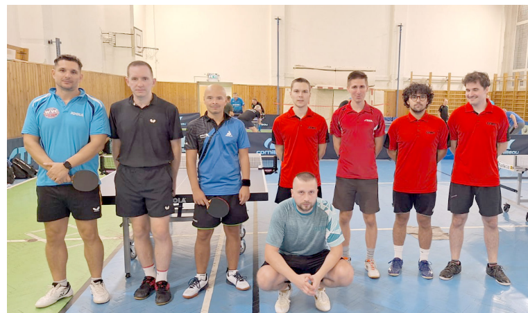
ŠKST má za sebou svoje prvé ligové zápasy.