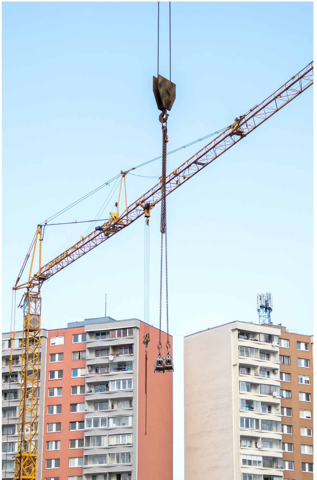
Petržalka je rozvojové územie s veľkým stavebným potenciálom a cez ruky odborných zamestnancov stavebného úradu musia prejsť všetky nové projekty.

Najčastejšie na stavebný úrad chodia ľudia so stavebnými úpravami v panelákových bytoch, ročne dostanú aj päťsto ohlásení. „Pôvodný bytofond starne, veď vlni sídlisko oslávilo päťdesiatku. Na druhej strane sa do Petržalky sťahuje veľa mladých ľudí, ktorí majú iné predstavy o tom, ako by mali vyzerat' ich byty a na základe tých predstáv ich modernizujú. Samozrejme, pokiaľ je to