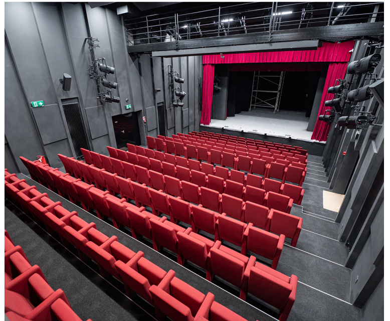
Po desiatich rokoch putovania sa Bratislavské bábkové divadlo vrátilo do komplexne zrekonštruovanej budovy na Dunajskej ulici v Starom Meste.