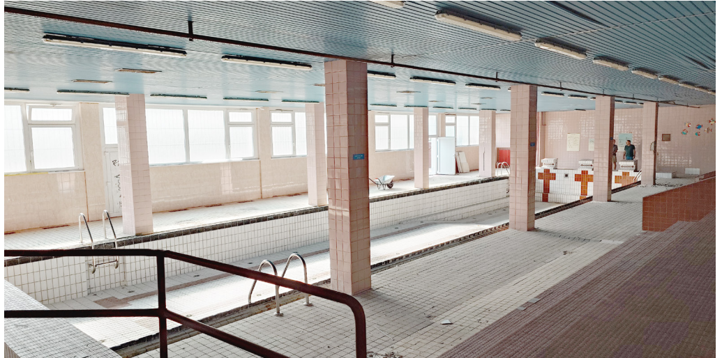
Odhadovaný termín konca rekonštrukcie školského bazéna na ZŠ Holíčska je august 2025.

Keďže celková cena prác sa odhaduje na zhruba 1,5 milióna eur, samospráva sa bude na financovaní rekonštrukcie spolupodieľať. Na obnovu plavárne pôjde z jej rozpočtu viac ako 516-tisíc eur.