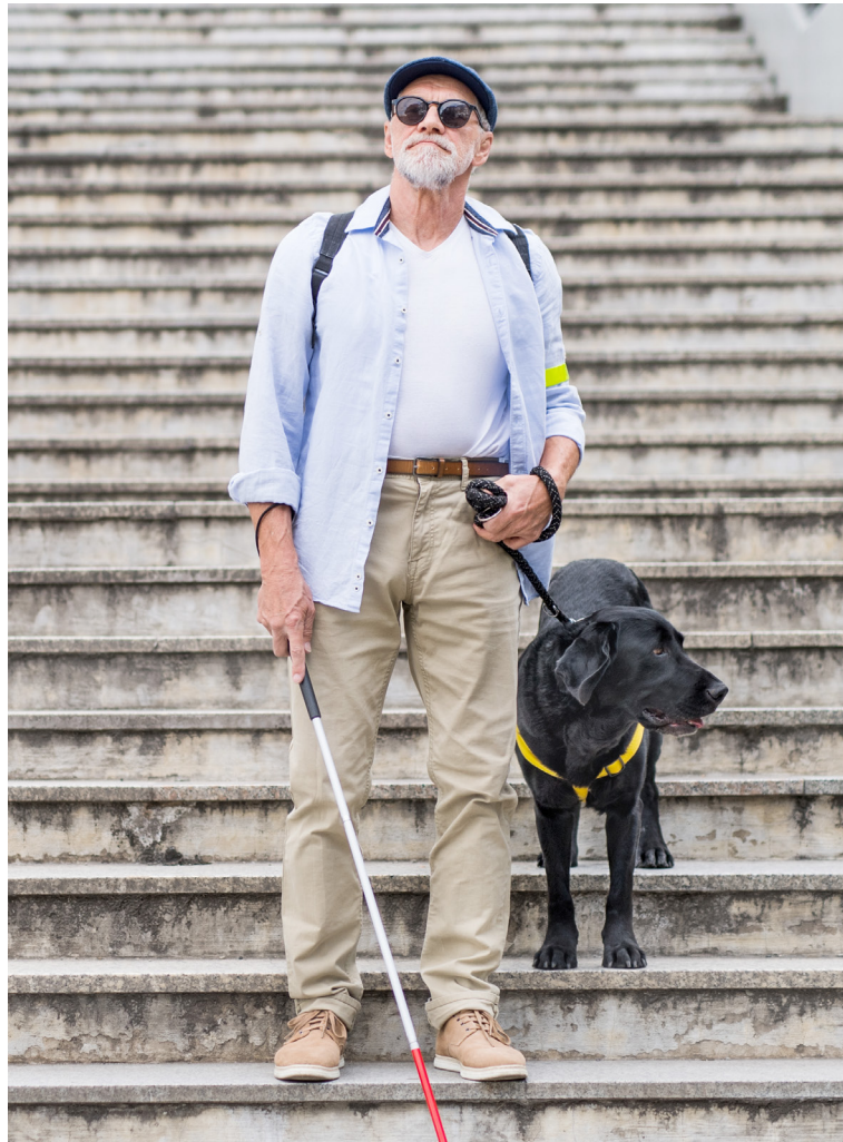
Najvyžívanejším plemenom vodiacich psov je labrador.

Do Petržalky sa škola presťahovala pred piatimi rokmi. „Hľadali sme väčšie priestory, keďže tie naše boli pre počet našich psov nevyhovujúce,“ vysvetľuje Virágová. Pátranie po novom domove vraj trvalo dlho. Svoje iste urobili aj obavy budúcich susedov z hlasného štekotu a aj ohrozenia hygienického štandardu. Ako sa ukázalo – celkom neopodstatnené. „Predtým tu fungovala autodiela alebo predajňa náhradných súčiastok... Keď sme žiadali o zmenu účelu nájmu, bol tu jeden pán, ktorý robil všetko