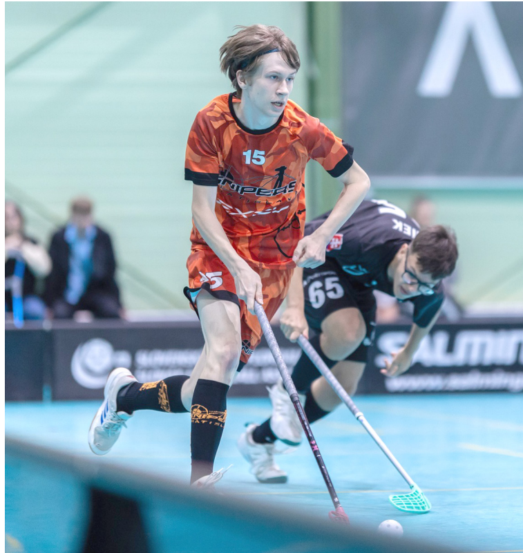
Florbal je prezentovaný ako bezkontaktný šport, ale nie je to úplne pravda, súbojov je tam pomerne dosť.

Apropos, turnaje. V Snipers zastávajú filozofiu čím viac, tým lepšie. „Keď chcete byť v športe dobrý, treba chodiť na turnaje – doma aj do zahraničia. Okrem toho, že si zmeriate sily, uvidíte, ako sa hrá inde, čo je skvelé