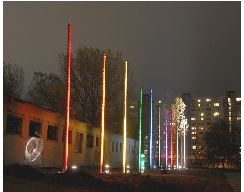
Spoločné dielo Stana Filka a Fedora Blaščáka.