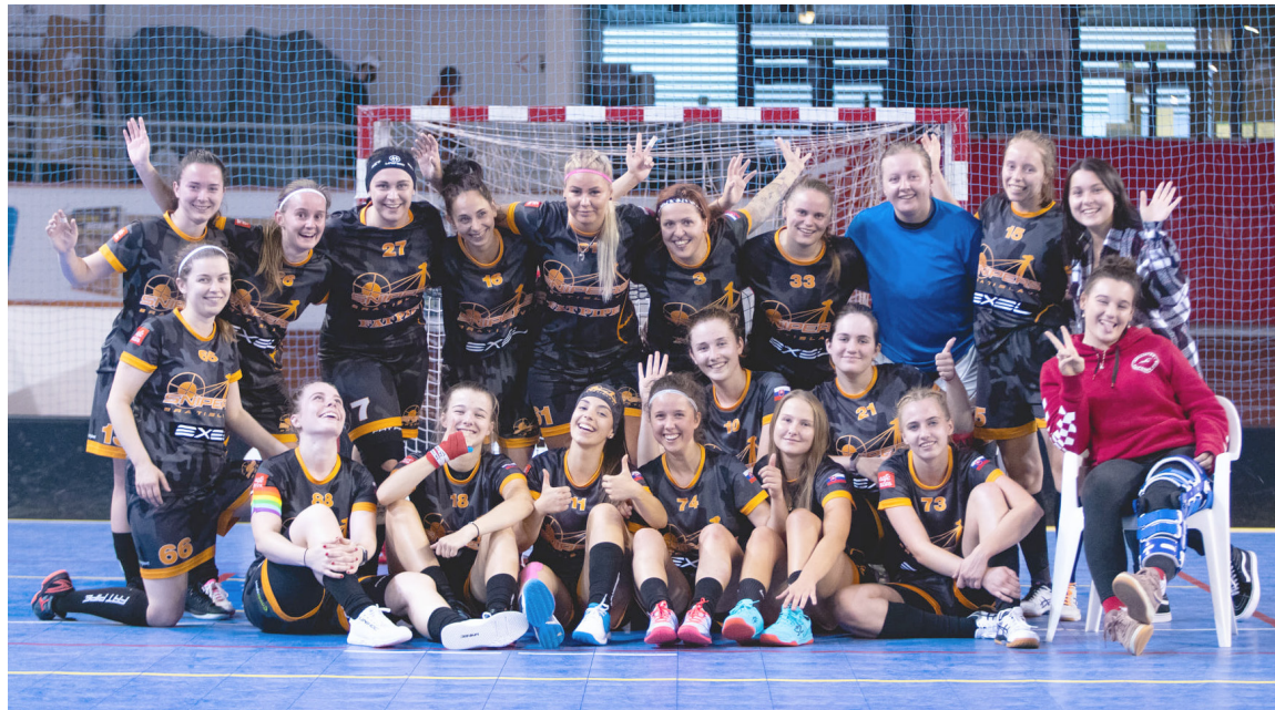
Pred štyrmi rokmi začali Snipers pracovať aj so ženami, vlani sa prebojovali do najvyššej florbalovej súťaže.

A to sa im aj darilo. „V rámci mužšov je to zatiaľ slabšie – síce už päť