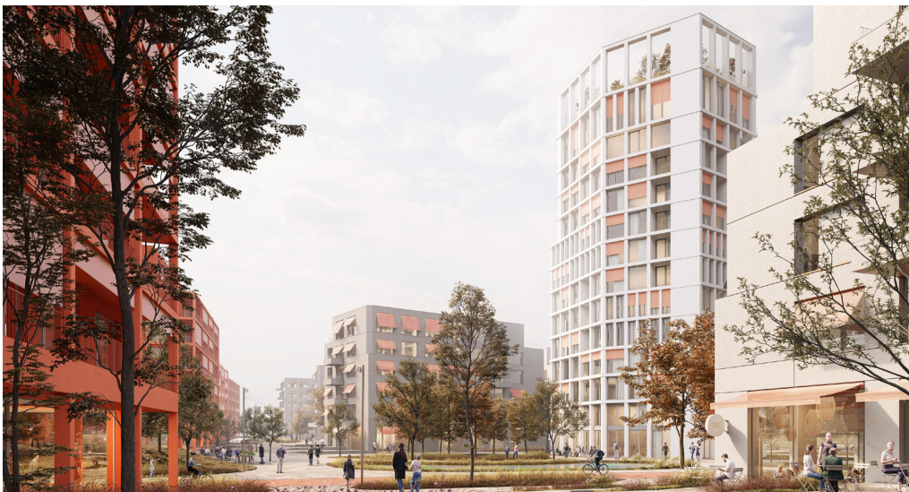
Vítaný návrh ateliéru What Architects, Slnčnice Zóna viladomy.

Posledná etapa Zóny viladomy v mieste kopca, ktorú čaká premena, bude teda citlivo nadväzovať na existujúcu štvrť. V ateliéri sa snažili napojiť na vytvorený architektonický rukopis, ako však dodávajú, do projektu vložili i nový princíp – nepravidelné radenie hmôt, vďaka čomu sa budú snažiť navodzovať prekvapivé situácie. Tak sa nechajme prekvapiť. ■