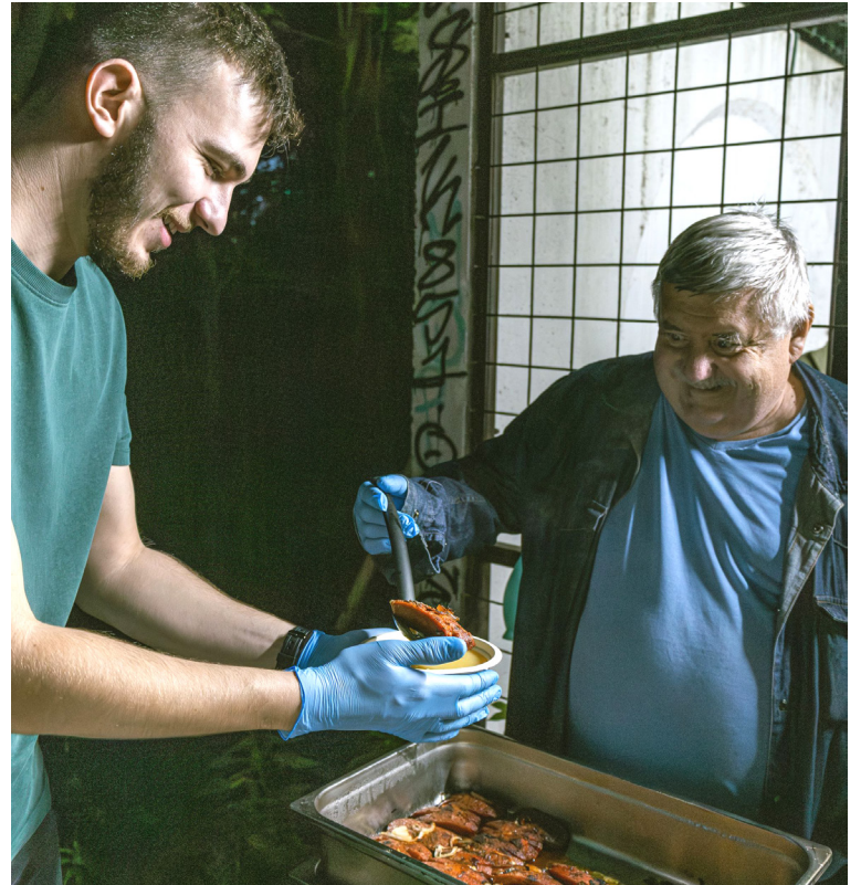
Kontaktné miesta pre ľudí bez domova budú fungovať od 15. novembra – vždy v utorok a v štvrtky. Okrem Rovniankovej pribudne aj Haanova.

Korec sa neobáva, že by sa ľudia bez domova o pomáhajúcich aktivitách petržalskej samosprávy nedozvedeli. „Už teraz si začneme robiť ‚reklamu‘ v pondelky na Haanovej a predpokladáme, že sa to veľmi rýchlo rozšíri. No nespoliehame sa iba na to, budeme tiež informovať mimovládne organizácie a spriatelene