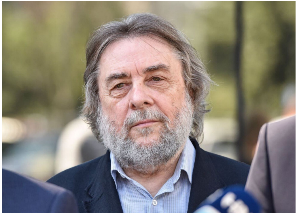
„Sloboda nie je o tom, že si môžem robiť, čo chcem. V prvom rade musím vedieť, čo chcem, čiže sloboda súvisí so vzdelaním,“ hovorí bývalý trojnásobný minister kultúry a osobnosť Novembra '89 Ladislav Snopko.

K tomu vám poviem jeden príbeh: Ja som z Tatier a bol som raz – asi pred piatimi rokmi – v Poprade nakupovať. Zrazu pán, asi v mojom veku, dotlačil ku mne svoj vozík, lebo ma spoznal, a začal mi nadávať na tému, o ktorej hovoríte: za boľševika bolo lepšie, mlieko bolo za dve koruny, rohlík za 40 halierov