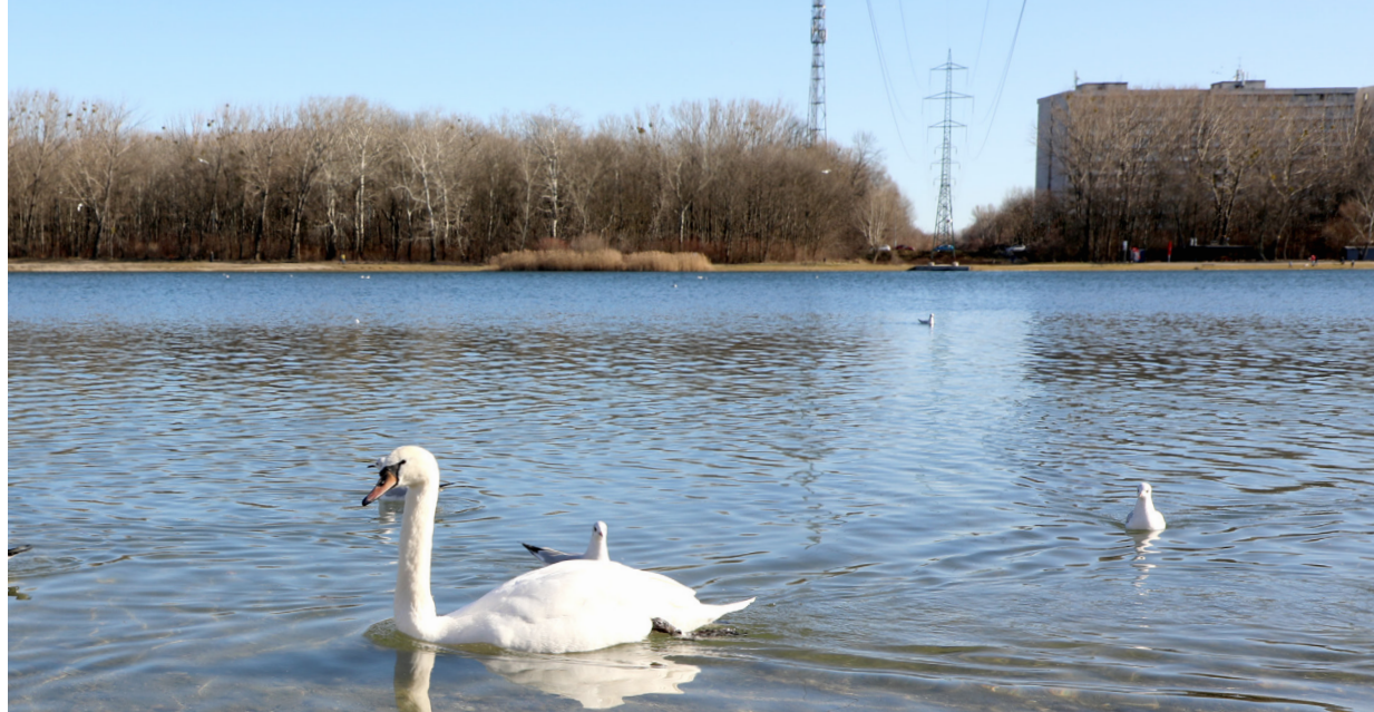
Prekládka veľmi vysokého napätia na Draždiaku by zvýšila bezpečnosť na obľúbenom mieste Petržalčanov.