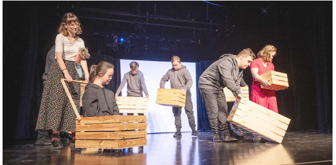
Na festivale dramatickej tvorivosti sa predstavilo sedemnást divadiel so zdravotne znevýhodnenými hercami.

„Týmto podujatím sme chceli dať možnosť ľuďom zo zariadení sociálnych