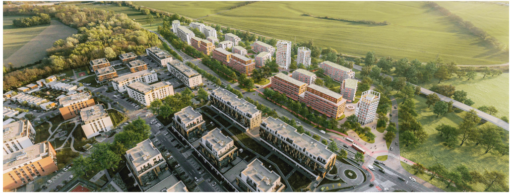
Vítaný návrh ateliéru What Architects, Slnčnice Zóna viladomy.

Snažili sa zistiť, aké je to bývať v Slnčniciach, zariadili tam niekoľko bytových interiérov, premýšľali, ako pochopiť tzv. petržalský kopec. A zjavne na to išli dobre, lebo architektonickú súťaž nakoniec vyhrali. Jednu z ďalších častí Slnčníc bude navrhovať architektonický ateliér What Architects.