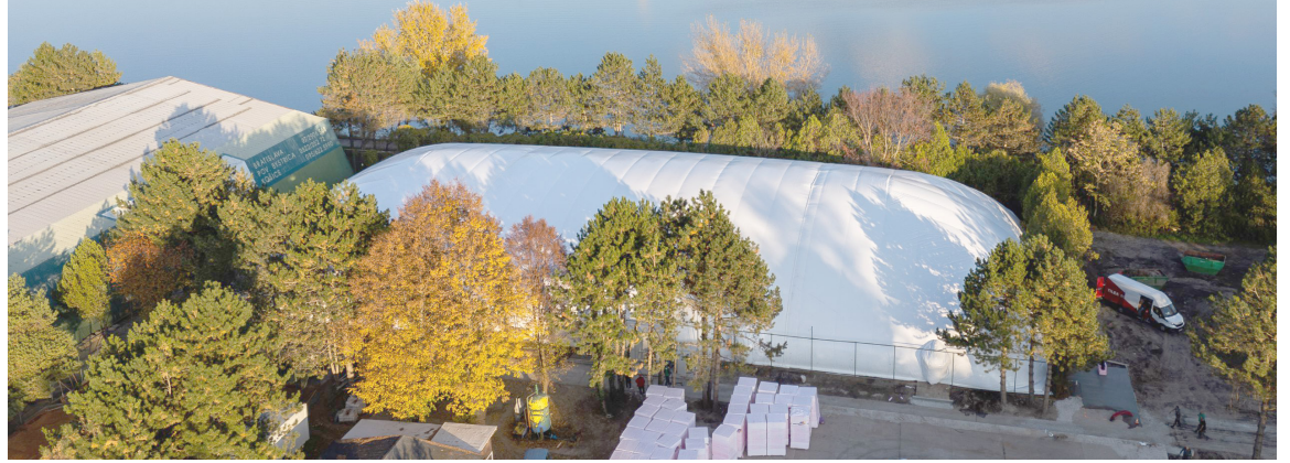
Nafukovacia hala pri Draždiaku bude jednou z najmodernejších v Bratislave.

Už dnes je jasné, že nafukovacia hala bude slúžiť na športové účely,