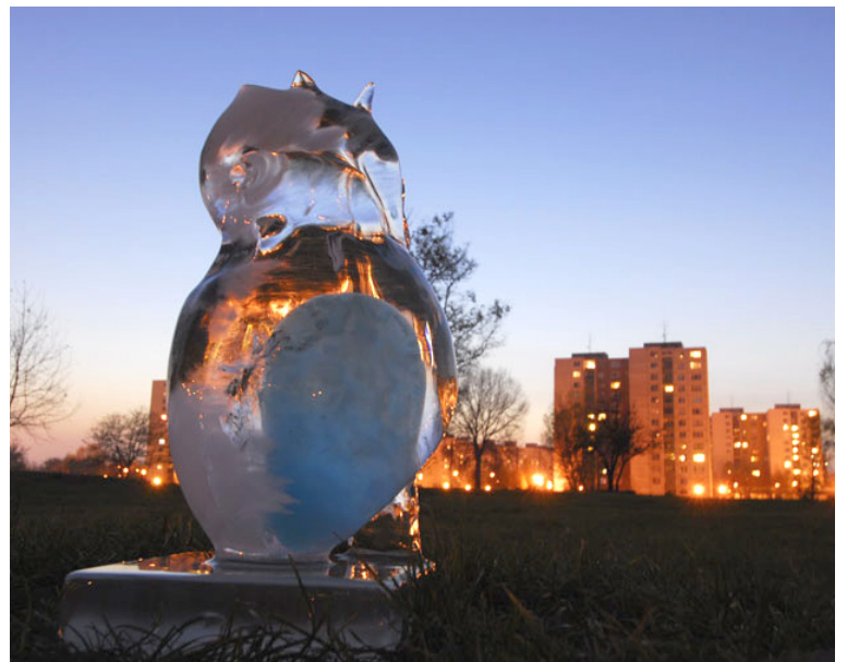
Landartový happening s topiacimi sa ľadovými sochami maďarskej výtvarníčky Rózy el Hassan.