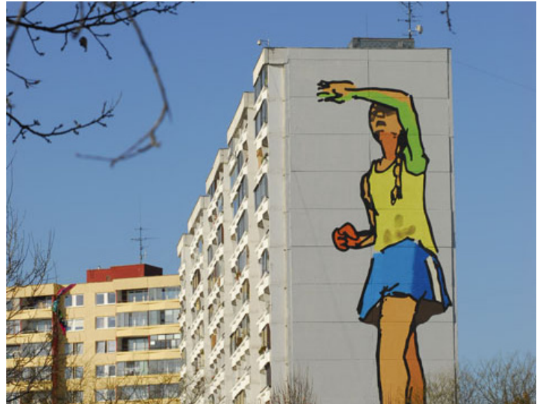
Monumentálna maľba Oslepená slnkom , ktorú vytvoril Igor Korpaczewski.

Realizáciu výskumu podporil z verejných zdrojov formou štipendia Fond na podporu umenia.