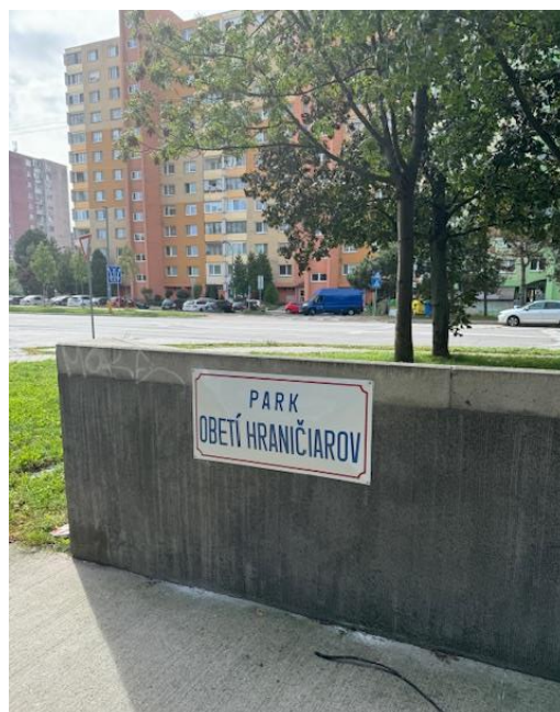
Osadené tabule s označením verjeného priestranstva „Park obetí hraničiarov“

V nadväznosti na uvedený návrh na pomenovania parku, bol predložený aj návrh na zmenu názvu zastávky MHD „Námestie Hraničiarov“ na „Park obetí Hraničiarov“. V súvislosti s týmto návrhom p. Kuruc informoval členov komisie, že táto požiadavka už bola predbežne prediskutovaná s Dopravným podnikom a. s. Predbežné finančné náklady spojené s premenovaním zastávky sú odhadované na 9 726,62 €. Na najbližšom zasadnutí sa komisia plánuje zaoberať premenovaním názvu celej ulice „Námestie Hraničiarov“.