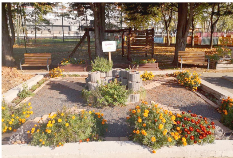
Záhrada dostala nový vzhľad.

ktoré skrášľujú a obohacujú celý priestor. Záhrada je určená pre rodičov s deťmi, pre členov záujmových útvarov Centra voľného času a pre mládež. Priestor sa využíva na príležitostné aktivity a podujatia a na denné letné tábory. Finančná podpora od Nadácie Veolia Slovensko pomohla pretvoriť ho na miesto pre celú komunitu.