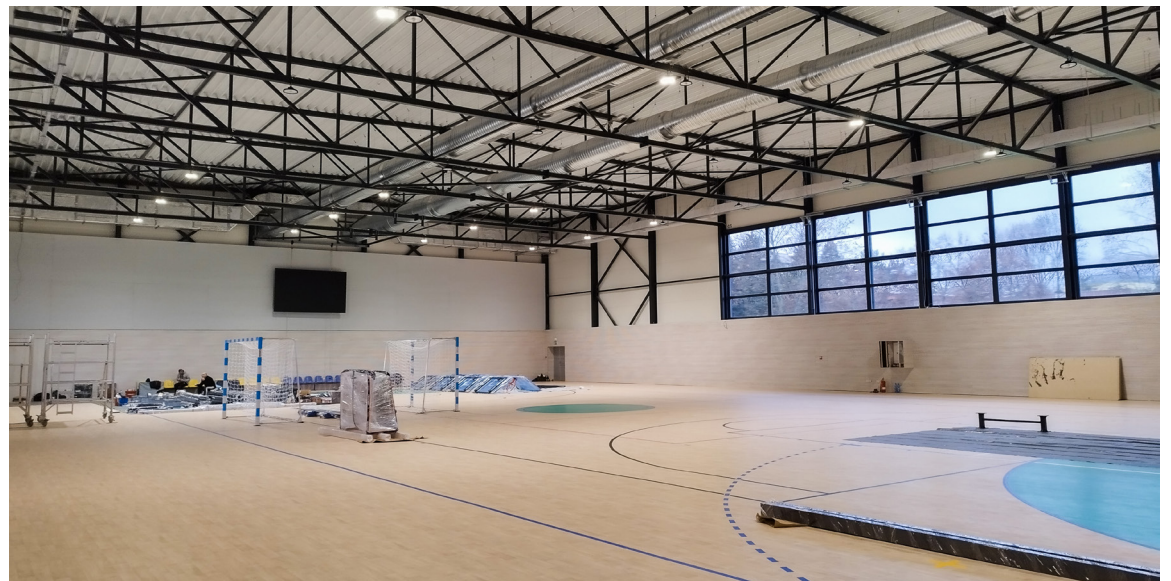
Športová hala na Pankúchovej je určená na basketbal, volejbal, nohejbal, futsal, bedminton a hádzanú.