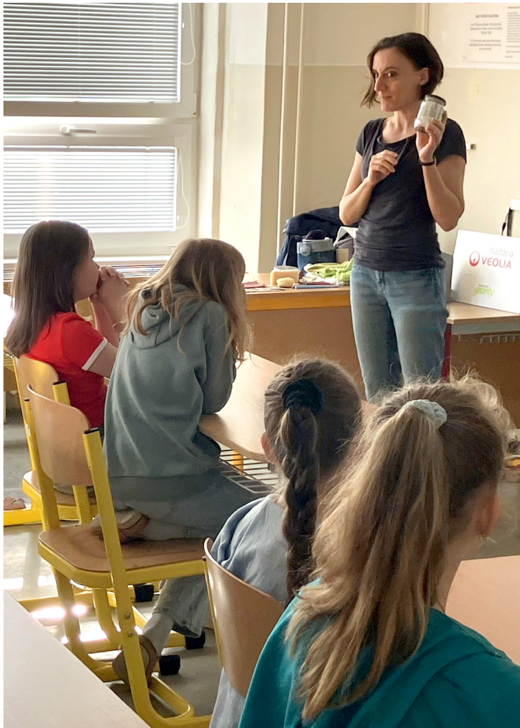
Žiaci vymýšľali nové formy využitia rôznych predmetov.