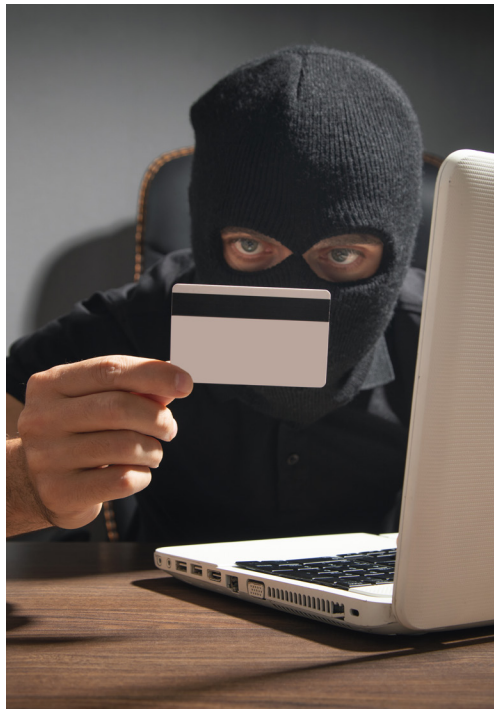
Ak niečo predávate, nikdy nezadávejte číslo platobnej karty, dátum expirácie a overovací kód.

Podvodné SMS (smishing): Tieto podvodné SMS správy vyzerajú ako správy od doručovacích spoločností, bánk alebo ako oznámenie o nejakej výhre. Cieľ je vždy rovnaký: získať vaše platobné údaje, prístupy do online bankovníctva alebo iné citlivé informá-