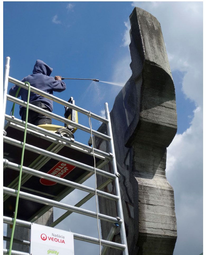
Betónová plastika Radosť v procese čistenia.