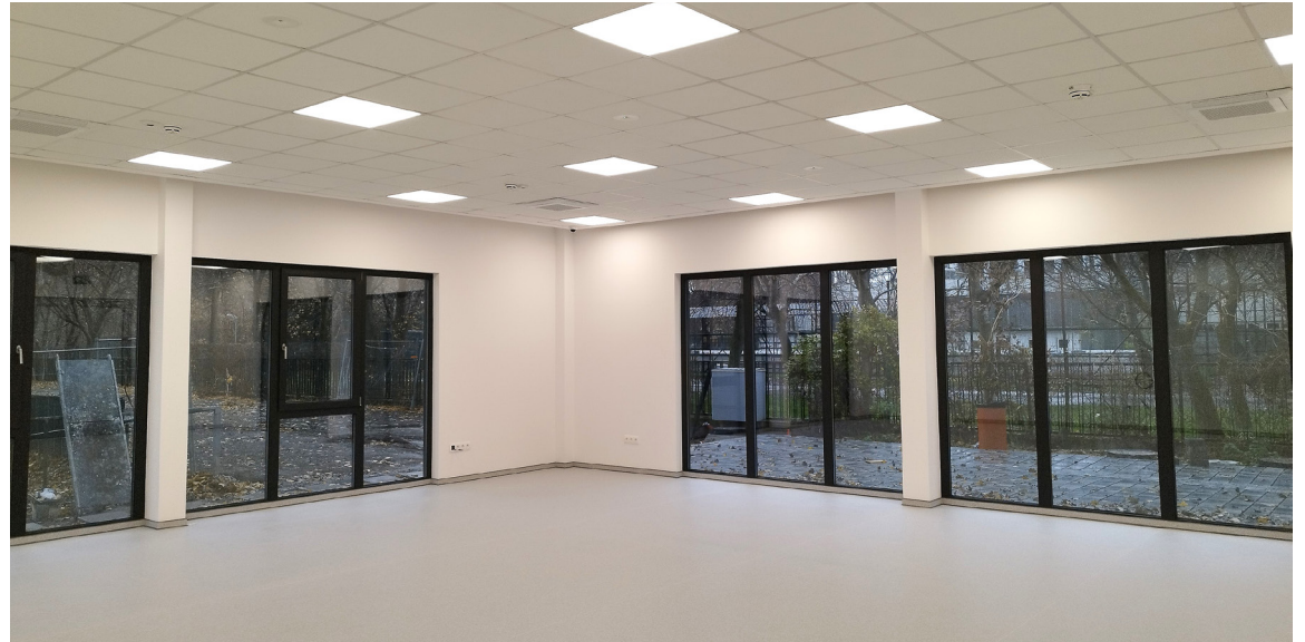
Súčastou haly je aj klubovňa.