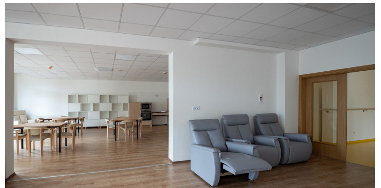
Vďaka deinštitucionalizácii centier sociálnych služieb vznikajú špecializované zariadenia, ktoré môžu poskytovať služby na osobnejšej a komfortnejšej úrovni.

Prvé špecializované zariadenie vyrástlo v obci Častá a komunitné rodinné prostredie vytvorilo dvanásť miest pre klientov, ktorí od mája bývajú v rodinnom dvojdomoch. V zariadení podporovaného bývania v Modre býva od augusta deväť prijímateľov sociálnej služby. Rekonštrukciou Domova sociálnych služieb v Modre-Kráľovej sa vytvorilo dvanásť miest pre klientov, ktorí sa doň nastťahovali začiatkom októbra. Novo postavené špecializované zariadenie a zariadenie podporovaného bývania v Dubovej obýva už od októbra dvanásť prijímateľov sociálnej služby.