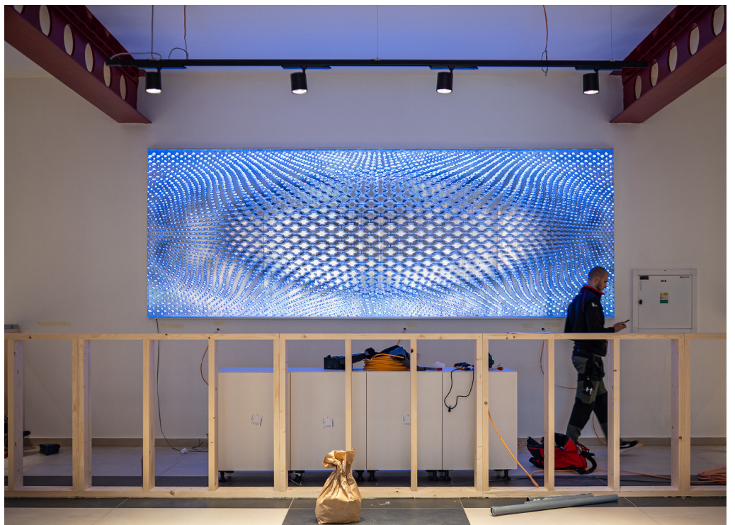
Divadlo Aréna má po novom aj špičkovú techniku, ktorá reflektuje najnovšie trendy v oblasti osvetlenia, zvuku a vizuálnej prezentácie.