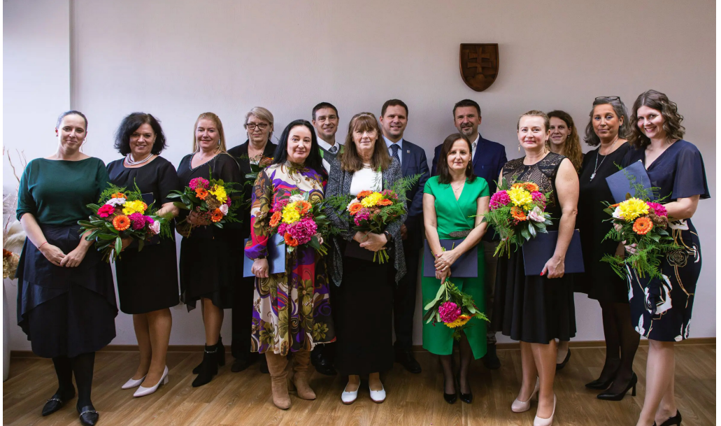
Pri príležitosti Svetového dňa učiteľov mestská časť ocenila deväť pedagogičiek a jedného pedagóga.