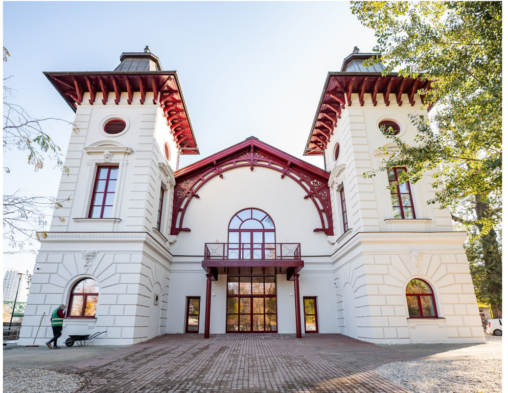
Obnova Divadla Aréna sa začala v roku 2021, ide o jednu z najväčších investícií BSK do kultúry.

Zachované a repasované boli mramorové schodiská, zábradlia s kovovými, fresky na stenách či nosníky masívnych železných trémov. Pribudli nové obrazovky, ktoré budú premietat' pripravované predstavenia.