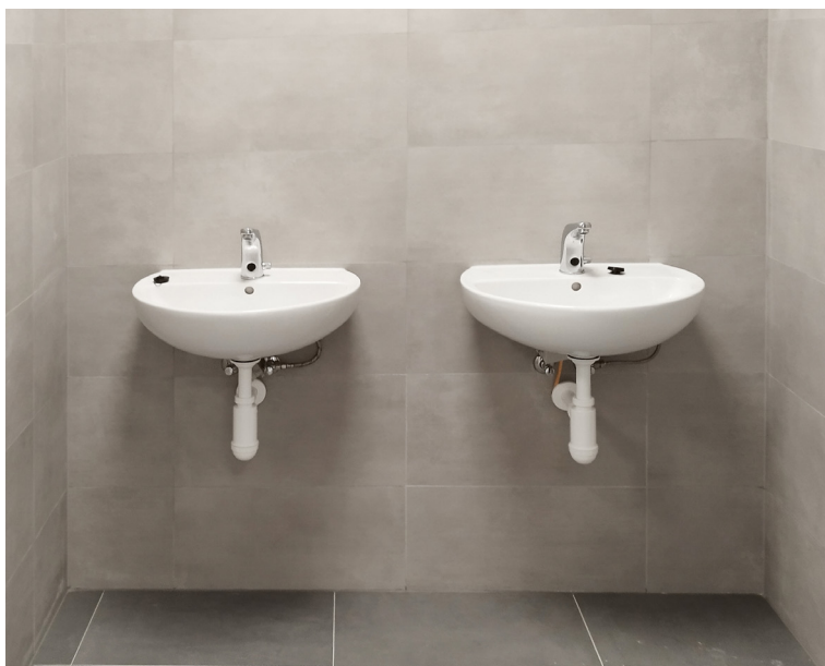
Sprchy a sociálne zariadenia sú pri každej zo šiestich šatní.

Súčasťou haly na Pankúchovej je aj priestranná klubovňa. „Využiť ju môže tréner s hráčmi po skončení zápasu na analýzu, keďže tam bude nainštalovaný projektor aj s plátnom, ale