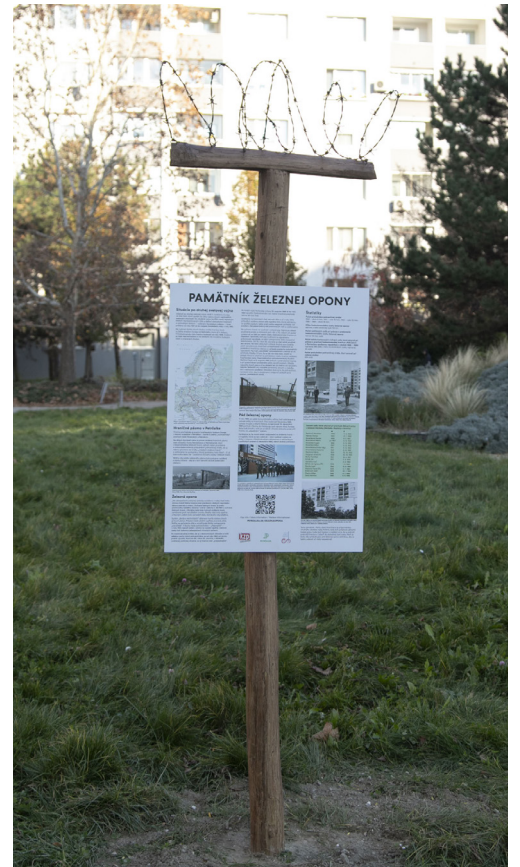
Pamätná tabuľa v Parku obetí Hraničiarov pripomína obeť železnej opony.