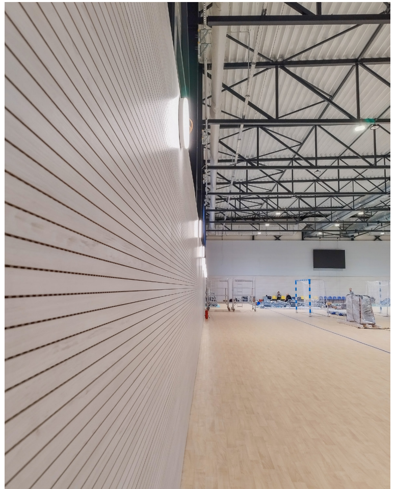
Hala je variabilná – na zápasy určené pre verejnosť sa dá rozložiť tribúna pre stovku divákov.

Hala úspešne prešla všetkými potrebnými technickými skúškami, pred prvým decembrovým dňom už chýbala „len vzduchotechnika a meranie hluku. To je však špecifické meranie, ktoré musí spĺňať presne dané podmienky, keďže prístroje sú umiestnené