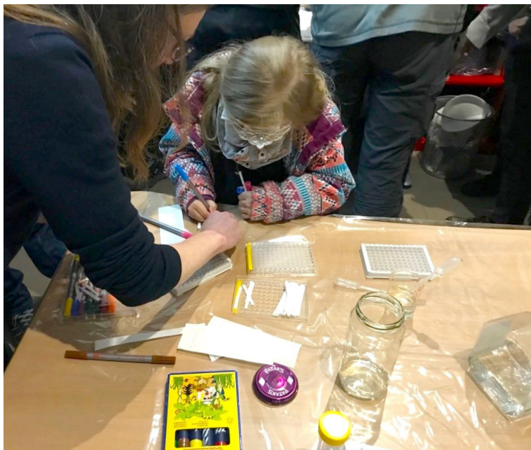
V Envirodielničke tvorili malí aj veľkí.

Občianske združenie Permoníci prevádzkuje na Jasovskej ulici Tvorivú Envirodielničku , ktorú sa počas roka podarilo vybaviť všetkým potrebným. Vďaka finančnej podpore od Nadácie Veolia Slovensko boli zakúpené zatemňovacie závesy, mikrofón s reproduktorom využívané pri prednáškach a besedách, a tiež rôzny materiál na tvorenie (vlna, farby, drevo, rôzne klnice, skrutky, lepidlo...) a ďalšie potrebné náradie. Časť financií sa využila aj na úhradu nákladov spojených s užívaním priestorov. V Envirodielničke sa podarilo zorganizovať niekoľko besied pod názvom Pondelkové štebotačky na zaujímavé témy o rastlinách a živočíchoch (Pasenie je spása,