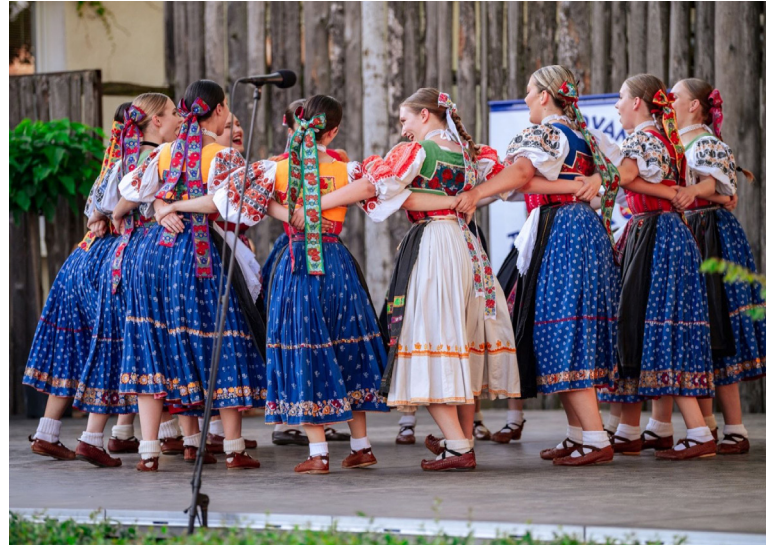
Folklórny súbor Ekonóm vznikol v roku 1969 na pôde Vysokej školy ekonomickej (dnes Ekonomická univerzita) v Bratislave.

História FS Ekonóm sa začala písať v máji 1969 na Vysokej škole ekonomickej (v súčasnosti Ekonomická univerzita v Bratislave). Členovia súboru vtedy – i dnes – prinášali do hlavného mesta kus svojho rodného kraja. Pestrosť a rozmanitosť prezentovaných regiónov dodnes zostala jednou z hlavných charakteristických črt Ekonómu. Za vyše päťdesiat rokov súbor formovali mnohí slovenskí choreografi, autori hudobných spracovaní a iné popredné osobnosti.