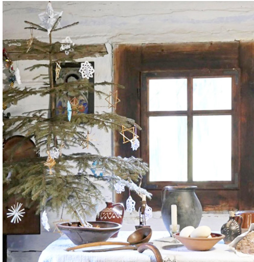
Zvyky na Vianoce sa líšia od regiónu k regiónu, no jedno majú spoločné – stretne sa celá rodina.

Vedeli ste, že na Štedrý deň nemohli ženy prekročiť prah ako prvé, ba dokonca ako prvé nemali ani prehovoriť? A ak im niečo chýbalo, nesmeli si to ísť požičať? Verilo sa totiž, že tento deň môžu zneužiť bosorky. Naopak, návšteva mužov, najmä mládencov, ktorí chodili od rána koledovať, bola vítaná. Symbolizovali totiž