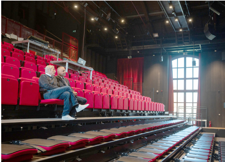
V rámci obnovy sa súčasťou divadelnej sály stalo zasúvacie hľadisko.